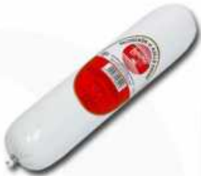
56001 Salchichón al Ajillo Cooked Garlic Sausage (1,5 kg aprox.) 4 uni. caja/box