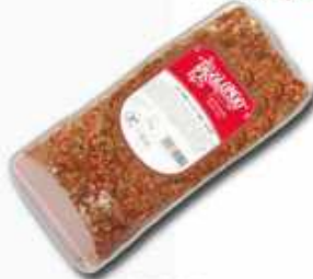
52512 Lomo Horno a las Finas Hierbas Oven Roasted Selected Herbs Loin 1/2 pieza/piece -(2,2 kg aprox.) 2 uni. caja/box