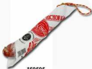
*50505 Salchichón Málaga Extra Spanish "Salchichón" (Málaga Style Premium Quality Salami) (250 g aprox.) 12 uni. caja/box