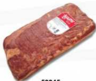
52045 Bacon Ahumado Selección 1820 1820 Selection Cooked Smoked Bacon (4,6 kg. aprox.) 2 uni. caja/box