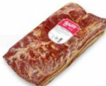
52022 Bacon S/Corteza Rindless Bacon 1 pieza/piece (2 kg. aprox.) 3 uni. caja/box