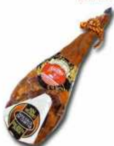
50849 Paleta Curada Duroc 100% sin Escápula Spanish "Paleta Duroc 100%" (100% Duroc Cured Shoulder without Scapula) (4-5 kg aprox.) 2 uni. caja/box