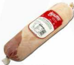
52608 Magreta al ajillo Garlic Rolled Pork Belly (Magreta) (2,1 kg aprox.) 3 uni. caja/box