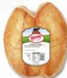
58066 Pechuga de Pavo Asada Roasted Turkey Crown (4,25 kg aprox.) 1 uni. caja/box