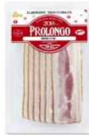
52039 Bacon s/corteza Vacío Vacuum Packed Rindless Bacon (100 g) 15 uni. caja/box