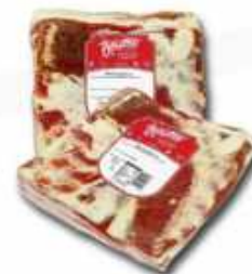
51601 Panceta Salada Refrigerada Salted Bacon 1/2 pieza/piece -(2,4 kg aprox.) 6 uni. caja/box