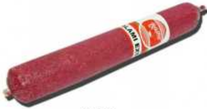
50524 Salami Extra Premium Quality Salami (1,5 kg aprox.) 4 uni. caja/box