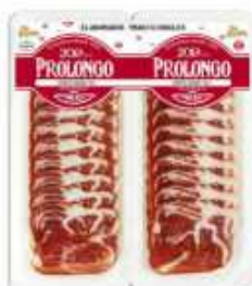
*51701 Lomito Duroc 50% 50% Duroc Air Dried Loin (2 x 50 g) 15 uni. caja/box