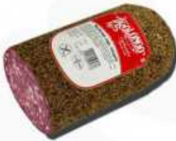
50537 Salchichón Tunel Pimienta Spanish "Salchichón" (Tunnel Peppered Salami) 1/2 pieza/piece (2,1 kg aprox.) 2 uni. caja/box