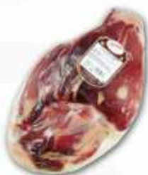
50842 Jamón Curado sin hueso Duroc 50% Spanish "Jamón Duroc 50%" (50% Duroc Boneless Cured Ham) (4,8 kg aprox.) 2 uni. caja/box