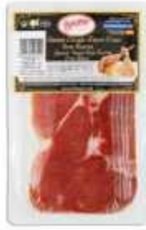
51829 Jamón Curado Duroc 50% Spanish "Jamón Duroc 50%" (50% Duroc Cured Ham) (100 g en AP) 20 uni. caja/box