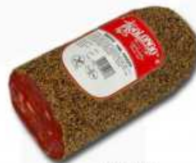
51016 Chorizo Lomo Tunel Pimienta Spanish "Chorizo" (Tunnel Peppered Chorizo) 1/2 pieza/piece - (2,1 kg aprox.) 2 uni. caja/box