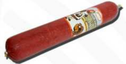
58101 Salchichón de Pavo Spanish "Salchichón" (Turkey Salami) (1,7 kg aprox.) 4 uni. caja