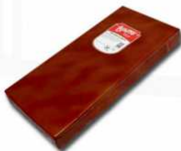
52018 Bacon Cocido Ahumado Rectangular Rectangular Cooked Smoked Bacon 1 pieza/piece (4,6 kg aprox.) 3 uni. caja/box