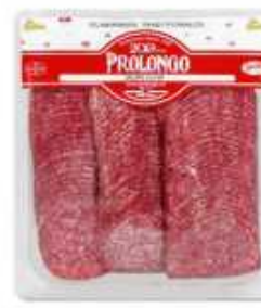
50943 Salami Extra 500 g Premium Quality Salami (500 g) 6 uni. caja/box