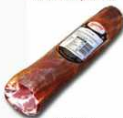
*50802 Lomito Duroc 50% 50% Duroc Air Dried Loin (0,7kg aprox.) 6 uni. caja/box