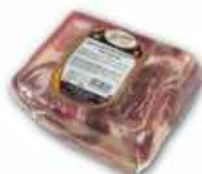
50866 Paleta Curada Duroc 100% s/h G. R. Spanish "Paleta Duroc 100%" (100% Duroc Boneless Cured Shoulder in block) (2,5 kg aprox.) 2 uni. caja/box