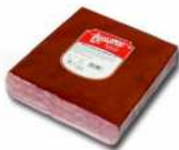
52013 Bacon Cocido Ahumado Rectangular Rectangular Cooked Smoked Bacon 1/2 pieza/piece -(4,9 kg aprox.) 6 uni. caja/box