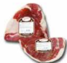
50815 Paleta Curada Duroc 100% sin hueso 1/2 Spanish "Paleta Duroc 50%" 1/2 (100% Duroc Boneless Cured Shoulder) 1/2 pieza / piece (1,2 kg aprox.) 4 uni. caja/box