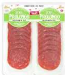
58155 Salchichón de Pavo Turkey Salami (2 x 50 g) 15 uni. caja/box