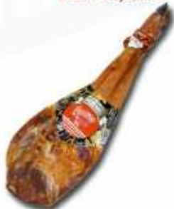
50822 Paleta Curada Duroc 100% Spanish "Paleta Duroc 100%" (100% Duroc Cured Shoulder) (4-5 kg aprox.) 2 uni. caja/box