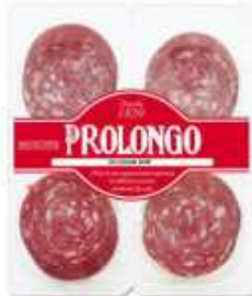
52138 Salchichón Gran Prolongo 4 x 30 g Grand Prolongo Salami (120 g) 9 uni. caja/box