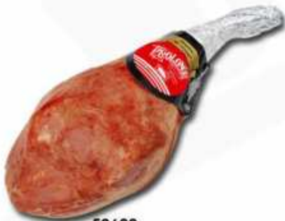
52620 Jamón al Horno Oven Baked Ham (8,5 kg aprox.) 1 uni. caja/box