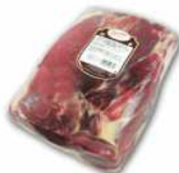
50843 Jamón Curado s/h Gran Rendimiento Duroc 50% Spanish "Jamón Duroc 50%" (50% Duroc Boneless Cured Ham in block) (4,8 kg aprox.) 2 uni. caja/box