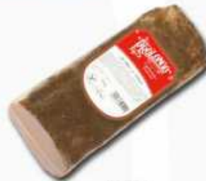
52513 Lomo Horno a la Pimienta Oven Roasted Peppered Loin 1/2 pieza/piece -(2,2 kg aprox.) 2 uni. caja/box