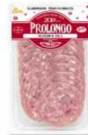
56018 Salchichón al Ajillo Cocido Vacío Vacuum Packed Cooked Garlic Sausage (100 g) 15 uni. caja/box