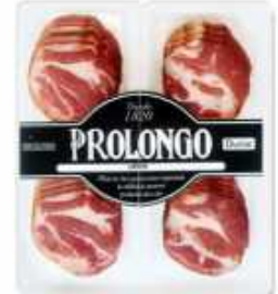
*51877 Lomito Duroc 50% 4 x 25 g 50% Duroc Air Dried Loin (100 g) 9 uni. caja/box