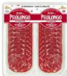
50982 Salchichón G. Prolongo Grand Prolongo Salami (2 x 50 g) 15 uni. caja/box