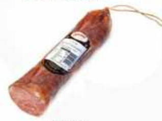
*50803 Lomo Duroc 100% 100% Duroc Air Dried Loin (1 kg aprox.) 6 uni. caja/box