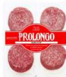
52139 Salami 4 x 30 g Premium Quality Vela Salami (120 g) 9 uni. caja/box