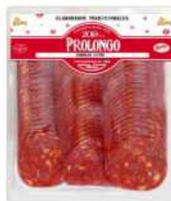
51068 Chorizo Vela Extra 500 g Premium Quality Vela Chorizo (500 g) 6 uni. caja/box