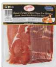
51831 Jamón Curado Duroc 50% 500 g Spanish "Jamón Duroc 50%" (50% Duroc Cured Ham) (500 g en AP) 4 uni. caja/box