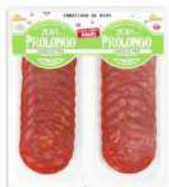
58154 Chorizo de Pavo Turkey Chorizo (2 x 50 g) 15 uni. caja/box