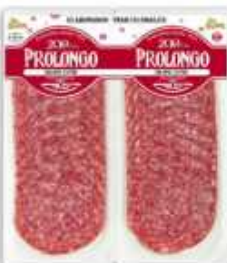
50984 Salami Extra Premium Quality Salami (2 x 50 g) 15 uni. caja/box