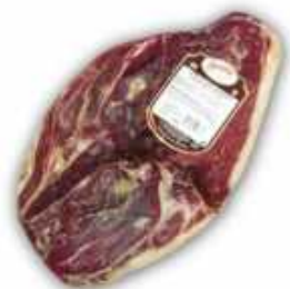
50836 Jamón Curado sin hueso Duroc 100% Spanish "Jamón Duroc 100%" (100% Duroc Boneless Cured Ham) (5,35 kg aprox.) 2 uni. caja/box