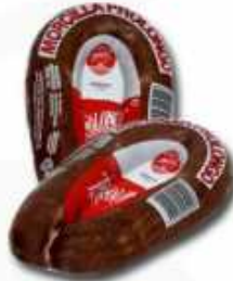
53002 Morcilla al Vacío Spanish "Morcilla" (Vacuum Packed Black Pudding ) (400 g aprox.) 15 uni. caja/box