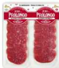
50983 Salchichón Extra Baguette Premium Quality Baguette Salami (2 x 50 g) 15 uni. caja/box