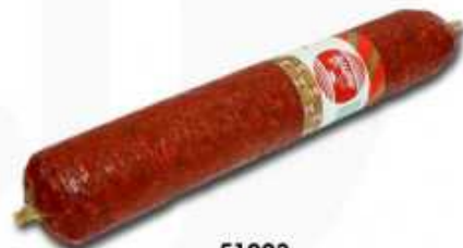
51023 Chorizo Vela Extra Spanish "Chorizo" (Premium Quality Vela Chorizo) (1,7 kg aprox.) 4 uni. caja/box