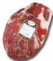
50859 Paleta Curada Duroc 100% sin hueso Spanish "Paleta Duroc 100%" (100% Duroc Boneless Cured Shoulder) (2,5 kg aprox.) 2 uni. caja/box