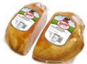
58089 Pechuga de Pavo Asada 1/2 Pieza Roasted Turkey Crown (2,12 kg aprox.) 2 uni. caja/box