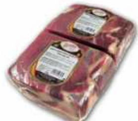
51801 Jamón Curado s/h Gran Rendimiento 1/2 Duroc 50% Spanish "Jamón Duroc 50%" 1/2 (50% Duroc Boneless Cured Ham in block) 1/2 pieza / piece (2,4 kg aprox.) 4 uni. caja/box