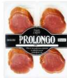
*51876 Lomo Duroc 100% 4 x 25 g 100% Duroc Air Dried Loin (100 g) 9 uni. caja/box