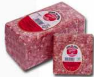
53504 - 53507 Budín de Cerdo Spanish "Budín de Cerdo" (Pork Pie) (2 kg aprox.) 4 uni. caja/box (500 g aprox.) 16 uni. caja/box