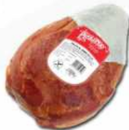
52629 Paleta al Horno Oven Baked Shoulder (4,5 kg aprox.) 1 uni. caja/box