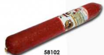
58102 Chorizo de Pavo Spanish "Chorizo" (Turkey Chorizo) (1,7 kg aprox.) 4 uni. caja/box