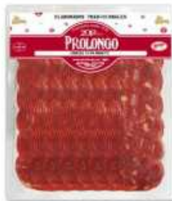
51059 Chorizo Vela Extra Baguette 500 g (Premium Quality Baguette Vela Chorizo) (500 g) 6 uni. caja/box