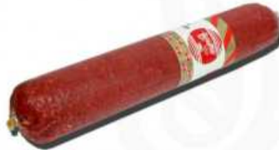
50525 Salchichón Gran Prolongo Spanish "Salchichón" (Grand Prolongo Salami) (1,8 kg aprox.) 4 uni. caja/box