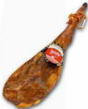
50832 Jamón Curado Duroc 100% Spanish "Jamón Duroc 100%" (100% Duroc Cured Ham) (7-9 kg aprox.) 2 uni. caja/box