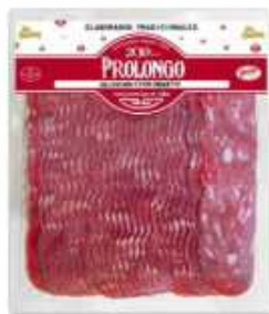
50904 Salchichón Extra Baguette 500 g (Premium Quality Baguette Salami) (500 g) 6 uni. caja/box