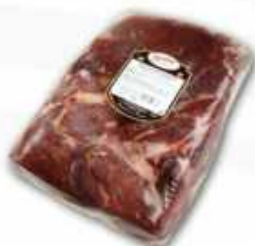
50841 Jamón Curado s/h Gran Rendimiento Duroc 100% Spanish "Jamón Duroc 100%" (100% Duroc Boneless Cured Ham in block) (4,8 kg aprox.) 2 uni. caja/box