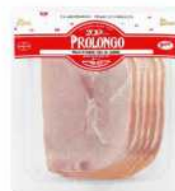
*52806 Paleta al horno Duroc 50% 50% Duroc Roasted Pork Shoulder (140 g) 7 uni. caja/box