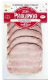
52522 Lomo Horno a la Pimienta Roasted Peppered Pork Loin (100 g) 15 uni. caja/box