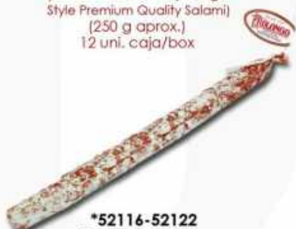
*52116-52122 Fuet Extra 220 g Spanish "Salchichón Fuet" (Premium Quality Salami) (220 g aprox.) 24 uni. ó 12 uni. caja/box