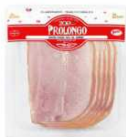
*52804 Jamón al horno Duroc 50% 50% Duroc Roasted Pork Ham (140 g) 7 uni. caja/box