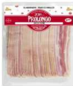
52020 Bacon s/corteza 500 g Packed Rindless Bacon (500 g) 6 uni. caja/box