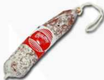
52120 Salchichón Casero Extra Spanish "Salchichón" (Traditional Premium Quality Salami) (200 g aprox.) 15 uni. caja/box