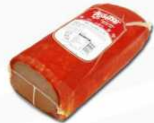
52641 Lomo Adobado Horno Marinated Oven Baked Loin 1/2 pieza/piece -(2,2 kg aprox.) 2 uni. caja/box