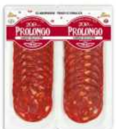
51121 Chorizo Vela Extra Premium Quality Vela Chorizo (2 x 50 g) 15 uni. caja/box