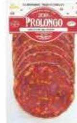
51088 Chorizo Túnel Pimienta Spanish "Chorizo" (Tunnel Peppered Chorizo) (80 g) 16 uni. caja/box