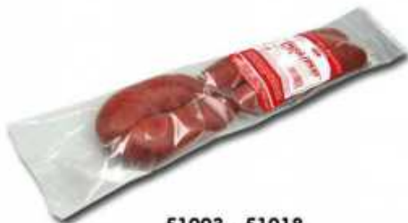
51003 - 51018 Chorizo Rosario Bolsa/Pack Spanish "Chorizo" (Rosario Chorizo) (450 g aprox.) 12 uni. Caja/Box (450 g aprox.) 12 Packs Caja/Box