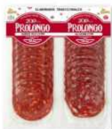
59029 Chorizo Vela + S.G.Prolongo Spanish "Salchichón + Chorizo" (2 x 50 g) 15 uni. caja/box