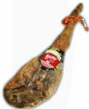
50831 Jamón Curado Gran Reserva Duroc 50% Spanish "Jamón Duroc 50%" (Gran Reserva 50% Duroc Cured Ham) (8 kg aprox.) 2 uni. caja/box