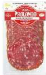
50951 Salchichón Túnel Pimienta Spanish "Salchichón" (Tunnel Peppered Salami) (80 g) 16 uni. caja/box