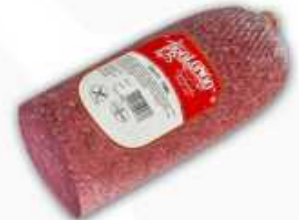
52129 Salami Tunel Sin Pimienta Spanish "Salami" (Tunnel No Peppered Salami) 1/2 pieza/piece (2,1 kg aprox.) 2 uni. caja/box