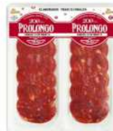
51120 Chorizo Vela Extra Baguette Premium Quality Baguette-Vela Chorizo (2 x 50 g) 15 uni. caja/box