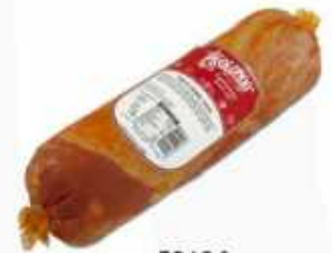
52604 Magreta Adobada Marinated Rolled Pork Belly (Magreta) (2,1 kg aprox.) 3 uni. caja/box