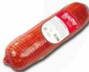
52501 Lomo Cocido Extra Premium Quality Cooked Pork Loin (2,1 kg aprox.) 3 uni. caja/box