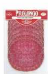
52133 Salami Túnel Pimienta Spanish "Salami" (Tunnel Peppered Salami) (80 g) 16 uni. caja/box