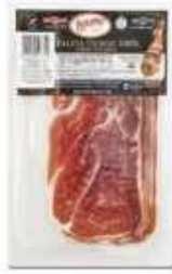
51871 Paleta Curada Duroc 100% Spanish "Paleta Duroc 100%" (100% Duroc Cured Shoulder) (100 g en AP) 20 uni. caja/box