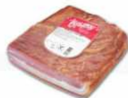
52052 Bacon Ahumado Selección 1820 1820 Selection Cooked Smoked Bacon 1/2 pieza/piece (2,3 kg aprox.) 4 uni. caja/box