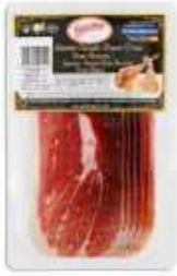
50845 Jamón Curado Duroc 100% Spanish "Jamón Duroc 100%" (50% Duroc Cured Ham) (100 g en AP) 20 uni. caja/box