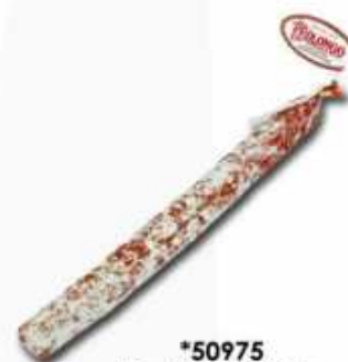
*50975 Fuet Extra 120 g Spanish "Salchichón Fuet" (Premium Quality Salami) (120 g aprox.) 25 uni. caja/box