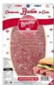
53529 Budín de Cerdo Spanish "Budín de Cerdo" (Pork Pie) (150 g) 10 uni. caja/box