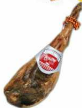
50883 Jamón Curado Bodega Duroc 50% Spanish "Jamón Duroc 50%" (Bodega 50% Duroc Cured Ham) (7 kg aprox.) 2 uni. caja/box