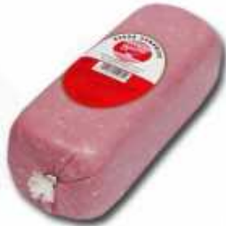
55060 Barra Sandwich Sandwich Meat (3,5 kg aprox.) 2 uni. caja/box