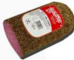
52131 Salami Tunel Pimienta Spanish "Salami" (Tunnel Peppered Salami) 1/2 pieza/piece (2,1 kg aprox.) 2 uni. caja/box