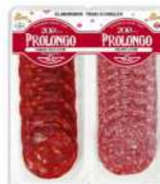
59031 Chorizo Vela + Salami Spanish "Salchichón + Salami" (2 x 50 g) 15 uni. caja/box