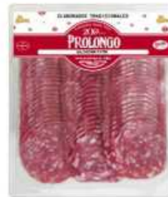
50942 Salchichón Gran Prolongo 500 g Spanish "Salchichón" (Grand Prolongo Salami) (500 g) 6 uni. caja/box